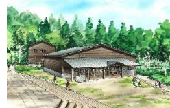
尾瀬沼ビジターセンター整備 等